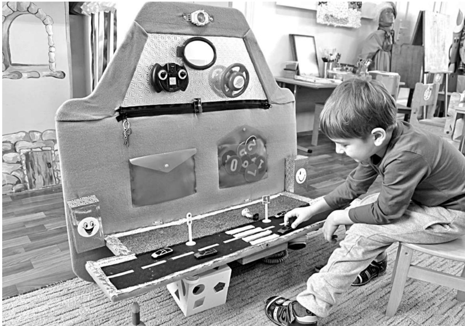
Игровая зона в детском саду № 8

СЕГОДНЯ СВОИМ ОПЫТОМ ДЕЛЯТСЯ УЧРЕЖДЕНИЯ ОБРАЗОВАНИЯ НОВООСКОЛЬСКОГО ГОРОДСКОГО ОКРУГА