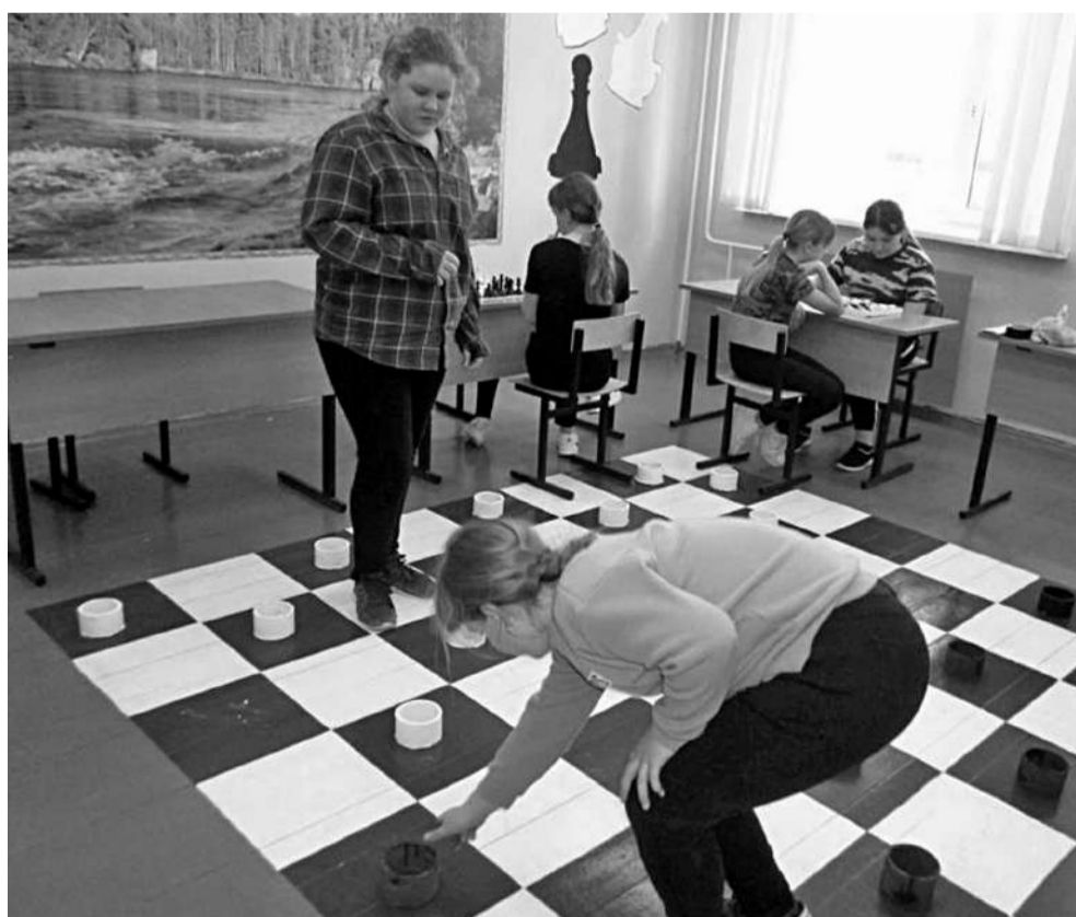
Игровая зона в Глинской школе